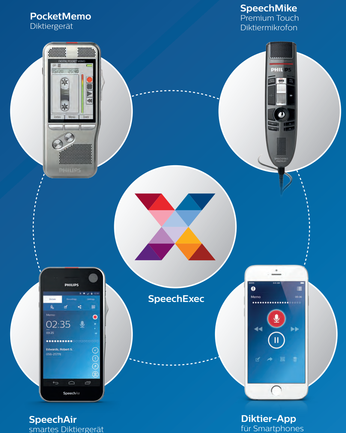
SpeechAir smartes Diktiergerät

Kompatibel mit allen Philips Diktiergeräten